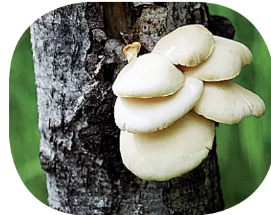
Pleurotes des neiges

- Plusieurs légumes et autres produits consommés par nos prédécesseurs sont tombés dans l'oubli. Par exemple, le topinambour, les gourganes, les courges, le sarrasin. On les redécouvre maintenant.